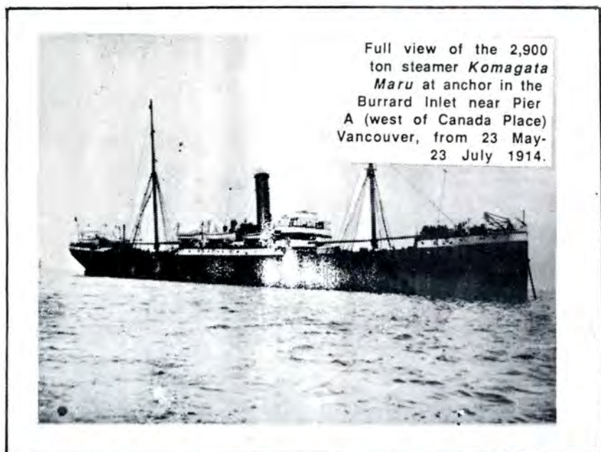
Full view of the 2,900 ton steamer Komagata Maru at anchor in the Burrard Inlet near Pier A (west of Canada Place) Vancouver, from 23 May-23 July 1914.